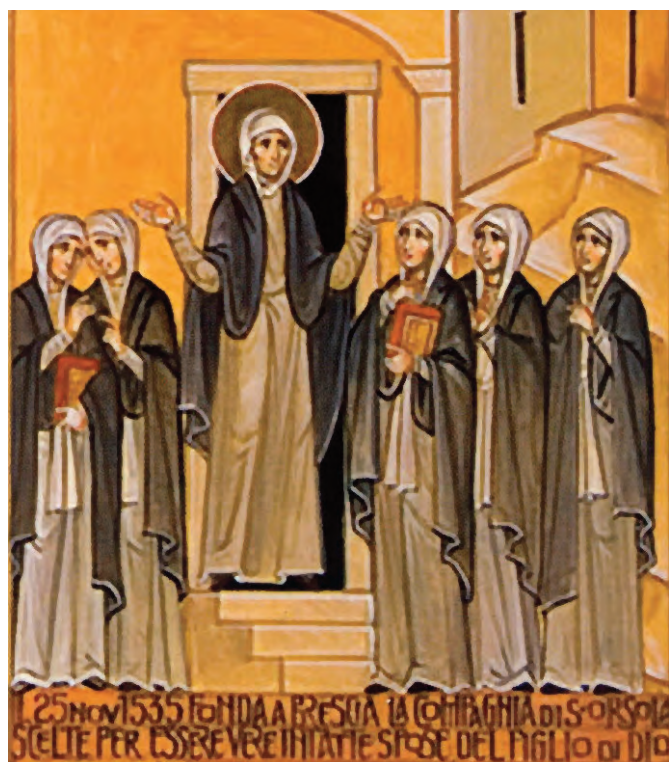
Fünfte Szene: Es genügt nicht, sich auf die heilige Ursula zu beziehen, um „Ursuline“ zu werden (oder Freunde der Ursulinen), man muss auf die heilige Angela Bezug nehmen, in eine „Compagnia“ eintreten.