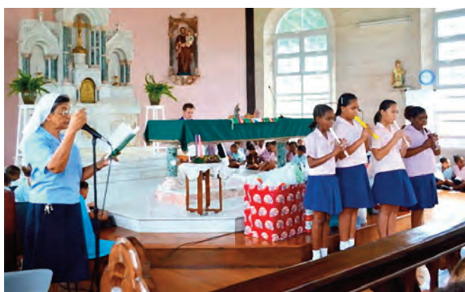
10 - In jedem Jahr werden bei unserer Weihnachtsfeier Geschenke für die Armen gesammelt.