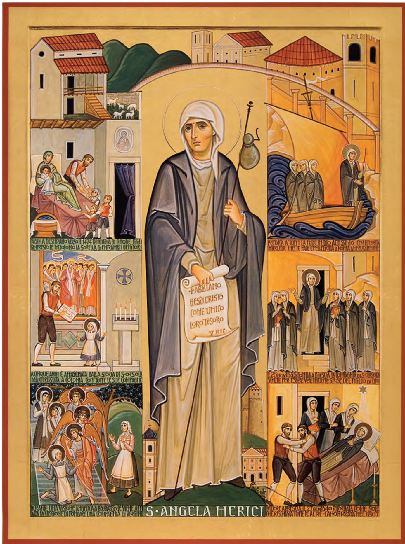
Ikone von Paolo Orlando, Gorizia, 2007