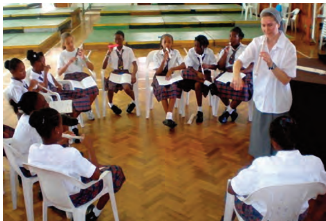
8 - Sr. Boguslawa aus Polen teilt ihre Talente mit Studentinnen, denen sie das Flötenspiel beibringt. Sie hat diese Gruppe schon in Jewish Dance unterrichtet, wofür sie einen Preis bekommen haben