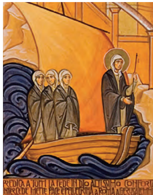
Vierte Szene: Das Antlitz Jesu und der Gekreuzigte; auf der Suche nach dessen Spuren pilgert sie bis Rom und Jerusalem. Im Heiligen Land verhindert eine schwere Augenerkrankung das natürliche Sehen. Trotzdem erinnert sie sich bis ins Kleinste an jede Einzelheit jener Orte.