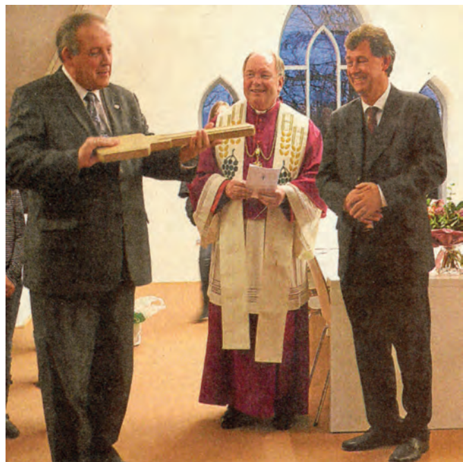
Symbolische Schlüsselübergabe in der Ursulinenschule.

Der erste Abschnitt der Baumaßnahmen zur Erneuerung der Erzbischöflichen Ursulinenschule Hersel wurde mit der Einweihung des neugestalteten Ursula-Traktes