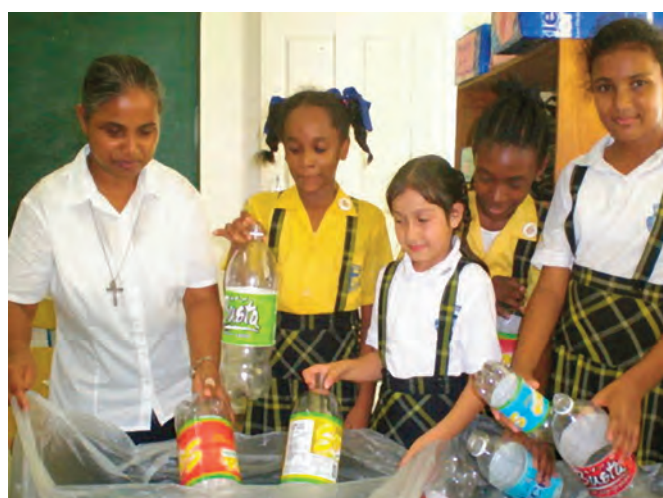
2 - Sr. Shelly gibt Religionsunterricht und Förderunterricht für Schüler mit Leseschwäche und koordiniert den Umweltclub an der Marian Academy

1976 übernahm die Regierung die Kontrolle über das gesamte Bildungswesen in Guyana, einschließlich der Bewertung der Schulen, die katholischen Einrichtungen gehörten und von ihnen geleitet wurden. 1992 gab es einen politischen Wandel, und infolge der starken Forderung und Unterstützung von einem großen Teil der