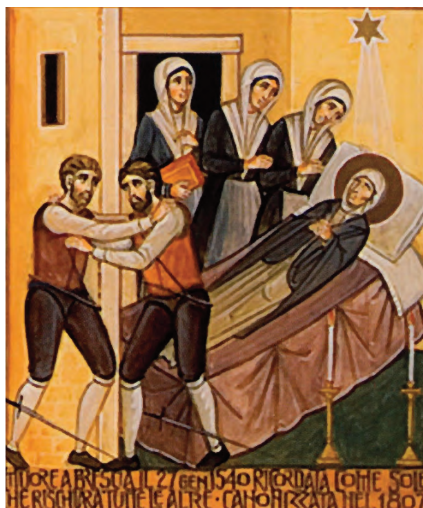
Sechste Szene: Am Ende ihres Lebens wird Angela selbst zur Ikone der bräutlichen Liebe zu Christus und der mütterlichen Liebe zu den Brüdern (und Schwestern). Frau des Friedens, Sonne, die alle erleuchtet, Stern, der am Himmel Gottes und in der Welt leuchtet.

Wir danken Sr. Carla Tamborini OSU, Oberin der Provinz Italien der Römischen Union, für die freundliche Überlassung der Bild- und Textrechte.