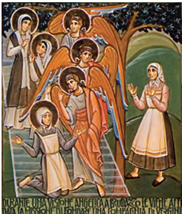
Dritte Szene: Die Vision der Engel und der Jungfrauen wird das ganze Leben lang in ihrem Herzen tief eingepägt bleiben. „Die Visionen der Heiligen sind sozusagen das Gemälde Gottes, durch das Er zu seinen ausgewählten Kindern spricht“. (A.Sicari)